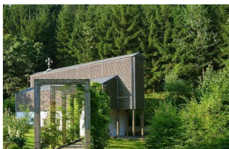
Hedwigsbründl Bad Zell

Steinreich und mystisch ist das Wanderparadies der Mühlviertler Alm und im Naturpark Mühlviertel. Auf Wiesen folgt Wald, auf Hügel folgt Tal, und allerorts gluckern muntere Bächlein oder thronen riesige Findling-Steine. Wer sie erklimmt, wird oft mit einer traumhaften Aussicht über eine Landschaft, die sich in Wellen wiegt, belohnt. Auf gut 80 km am Johannesweg und knapp 50 km am Stoakraftweg begegnet man alten Traditionen, besonderen Geschichten und kraftvollen Plätze. Nicht nur die unzähligen Naturschönheiten und Kleindenkmäler sind besondere Merkmale, sondern auch ihre Gastgeber. Kleine, aber feine Gaststuben laden zum Einkehren ein und verwöhnen mit kulinarischen Köstlichkeiten aus der Region. Wer Lust hat begibt sich auf eine spirituelle Reise und entdeckt viele Marterl, Kapellen, Kirchen u. heilige Bründl, die zur Besinnung anregen.